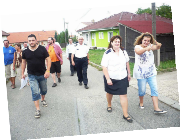
Hasiči ukazují naši Čistou hasičům z Čisté