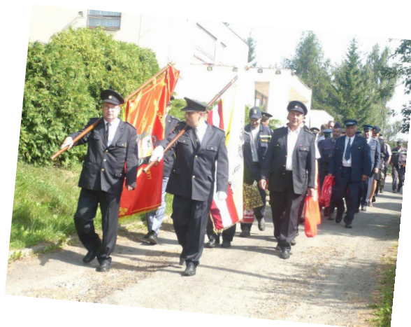
Jedna soutěž stíhá druhou