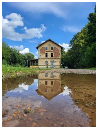
1. Šimon Váhala

Děkujeme všem amatérským fotografům za zaslání srpnových fotografií. Tentokrát se nám za měsíc srpen sešlo 20 krásných fotek a 7 nesoutěžních. Na všechny fotografie se můžete podívat do fotogalerie na stránkách obce.