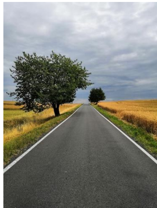
2. Karel Korbělář