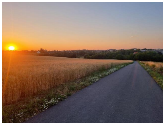
3. Václav Vít