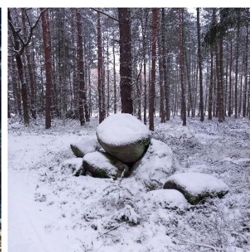
3. K. Cibulová

Děkujeme všem amatérským fotografům za zaslání fotografií. Tentokrát se nám za měsíc listopad sešlo 23 originálních fotografií. Na všechny fotografie se můžete podívat do fotogalerie na stránkách obce.