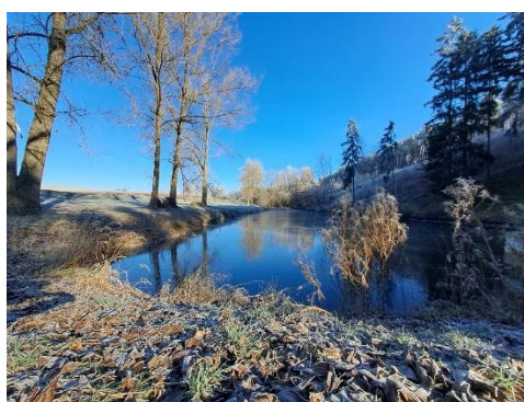
2. Z. Richter